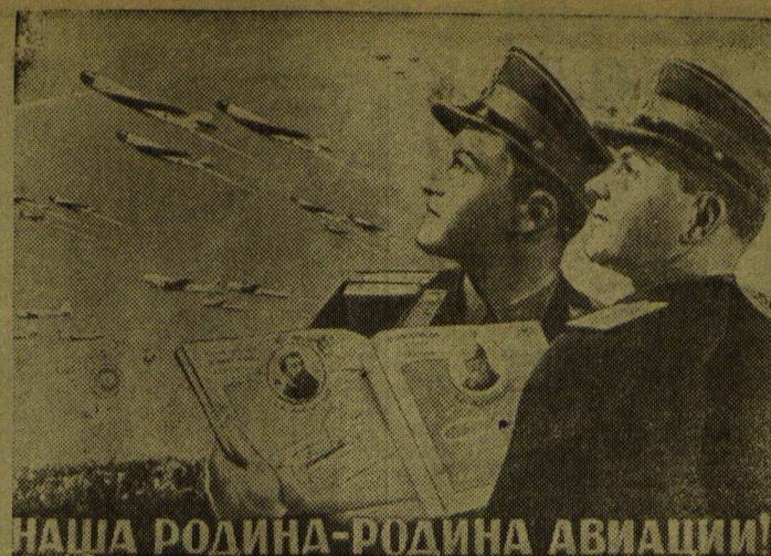
Плакат работы художников В. Корецкого и В. Гицевич, выпущенный издательством «Искусство».

И впредь наши летчики, штурманы, стрелки, наши техники и мотористы, наши ученые и работники авиационной промышленности будут настойчиво добиваться того, чтобы советские летчики летали быстрее, лучше и выше всех. Наша советская авиация служит интересам трудового человечества: она стоит на страже мира во всем мире, на страже строительства коммунизма, величественное здание которого воздвигает наш народ, народ-герой, народ-создатель, вдохновляемый и ведомый вперед большевистской партией, великим Сталиным.